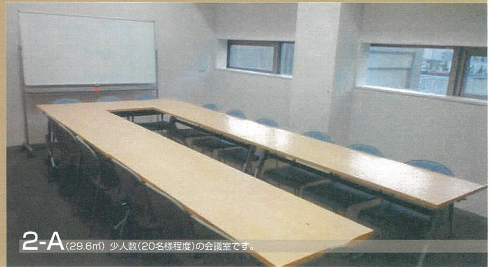
2-A (29.6㎡) 少人数(20名様程度)の会議室です。