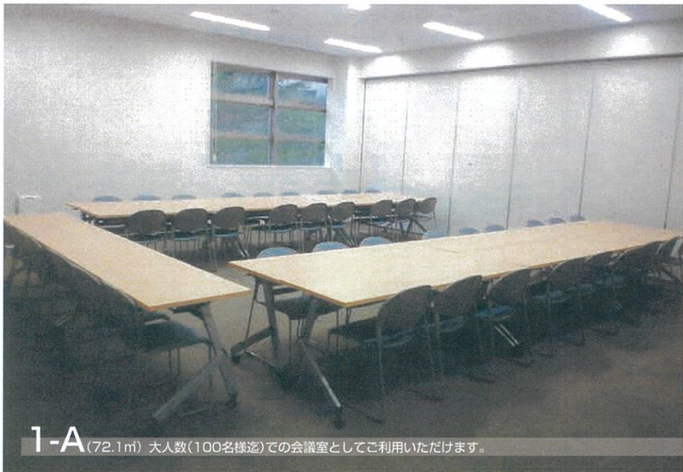
1-A (72.1㎡) 大人数(100名様程度)での会議室としてご利用いただけます。