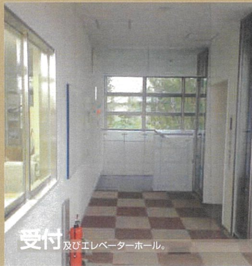
受付 及びエレベーターホール。