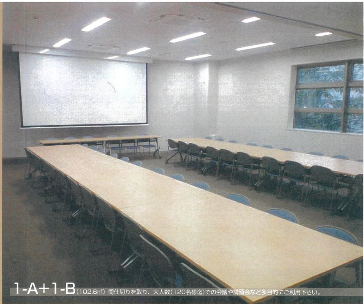
1-A+1-B (102.6㎡) 間仕切りを取り、大人数(120名様程度)での会議や講習会など多目的にご利用下さい。