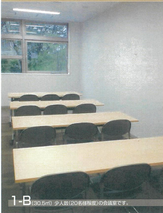
1-B (30.5㎡) 少人数(20名様程度)の会議室です。